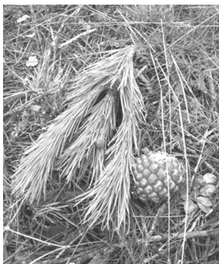
Figura 2. Ramilla derribada en comparación con una piña madura: presenta además una chota (al final del ramillo) y una perinola (en el eje cerca de la base)

En función de los daños y rendimientos observados se eligió un sistema de trabajo: 3s de vibración a 2000 r.p.m. en pies menores de 40 cm de diámetro y 6s a ese mismo régimen y haciendo trabajar alternativamente los dos motores (entra uno, sale y entra el otro) en los pies mayores de cuarenta. Nuevamente se analizaron los resultados con ese régimen “optimizado” para la máquina del primer año. En la campaña posterior el empleo de esa máquina fue prohibido en los montes gestionados por la Administración fundamentalmente por su excesivo peso pero también por sus elevados daños en los árboles.