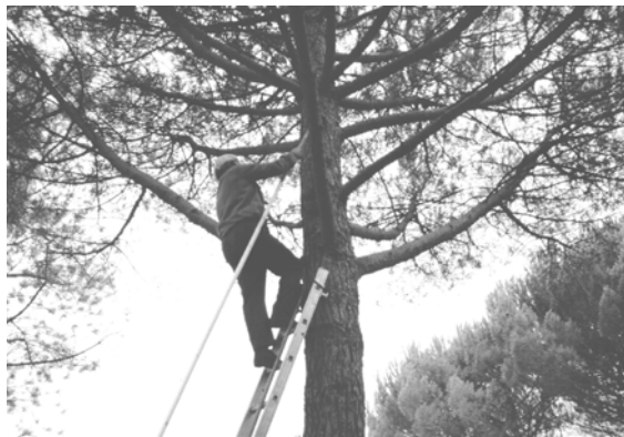
Figura 1: Recogida manual: el piñero trepa a la copa del árbol y desde ésta sin ningún arnés de seguridad derriba las piñas con la ayuda del gorguz.

con las condiciones edáficas: pinares de páramo sobre suelos poco profundos pero fértiles instalados sobre una roca madre caliza a escasa profundidad; y pinares de vega sobre suelos muy arenosos potentes, menos fértiles pero más adecuados para el pino piñonero. De cada uno de estos tipos de pinares se han elegido dos estratos: uno de ellos con arbolado de edades comprendidas entre los 40 y los 50 años y otro con arbolado de gran talla, de edades comprendidas entre 80 y 90 años. El sistema fue instalado el año 2000 por la Administración Forestal (Consejería de Medio Ambiente de la Junta de Castilla y León) con la colaboración de la Universidad de Valladolid, los ayuntamientos propietarios de los montes objeto de ensayo, los industriales piñeros y la asociación de propietarios forestales.