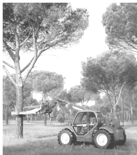
Figura 3. Máquina utilizada en la campaña 2002